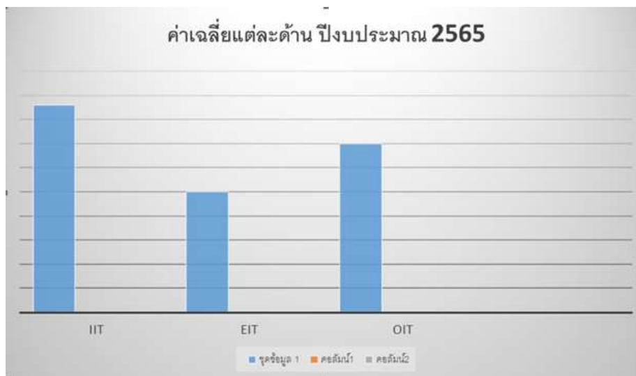
แผนภาพที่ 1 แสดงผลการวิเคราะห์ค่าน้ำหนักคะแนนตามแหล่งข้อมูล

- คะแนนแบบตรวจการเปิดเผยข้อมูลสาธารณะ (Open Data Integrity and Transparency Assessment: OIT) ประจำปี 2565 ได้คะแนนเท่ากับร้อยละเฉลี่ย 35.04 จากค่าน้ำหนักคะแนน 40 คะแนน