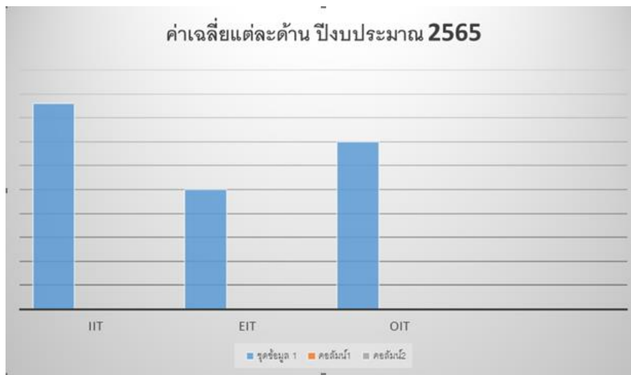
แผนภาพที่ ๑ แสดงผลการวิเคราะห์ค่าน้ำหนักคะแนนตามแหล่งข้อมูล

- คะแนนแบบตรวจการเปิดเผยข้อมูลสาธารณะ (Open Data Integrity and Transparency Assessment: OIT) ประจำปี ๒๕๖๕ ได้คะแนนเท่ากับร้อยละเฉลี่ย ๓๕.๐๔ จากค่าน้ำหนักคะแนน ๔๐ คะแนน