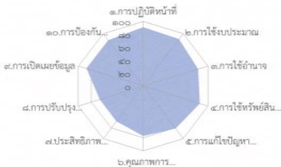
แผนภาพที่ ๒ ผลการประเมินจำแนกรายละเอียดตามตัวชี้วัด

หลังจากการร่วมวิเคราะห์ผลการประเมินคุณธรรมและความโปร่งใส คณะกรรมการฯ ตามโครงการเสริมสร้างคุณธรรม จริยธรรม และธรรมาภิบาลในโรงเรียนบ้านโคกพันโปง มีตัวชี้วัดจำนวน ๑๐ ตัวชี้วัดที่มีค่า คะแนนน้อยกว่าร้อยละ ๙๙ ได้ซึ่งถือว่าเป็นจุดอ่อนในการดำเนินงานของโรงเรียนบ้านโคกพันโปง และมีตัวชี้วัดที่ต้องพัฒนา และหาแนวทางแก้ไขเพื่อให้ได้ผลคะแนนร้อยละ ๙๙ และอยู่ในระดับ AA (Excellence) รายละเอียดดังนี้