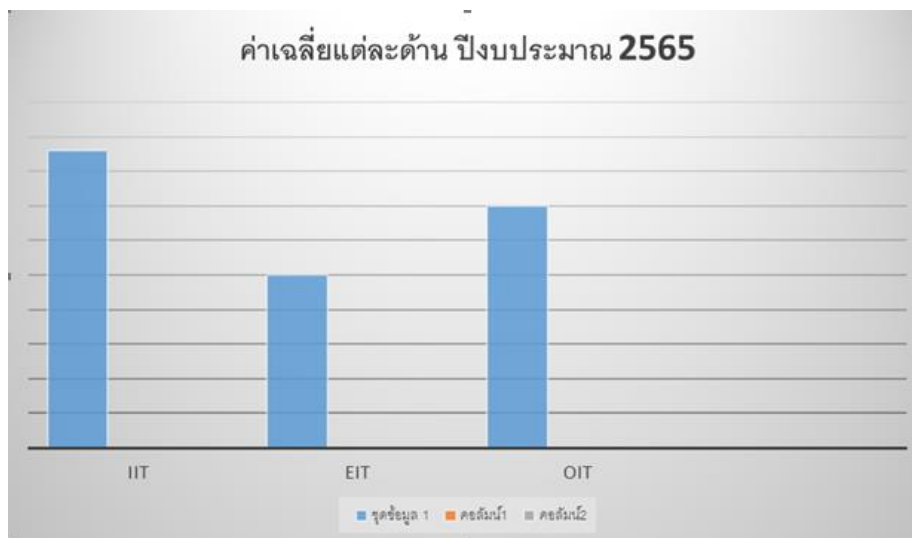
แผนภาพที่ ๑ แสดงผลการวิเคราะห์ค่าน้ำหนักคะแนนตามแหล่งข้อมูล

- คะแนนแบบตรวจการเปิดเผยข้อมูลสาธารณะ (Open Data Integrity and Transparency Assessment: OIT) ประจำปี ๒๕๖๕ ได้คะแนนเท่ากับร้อยละเฉลี่ย ๓๕.๐๔ จากค่าน้ำหนักคะแนน ๔๐ คะแนน